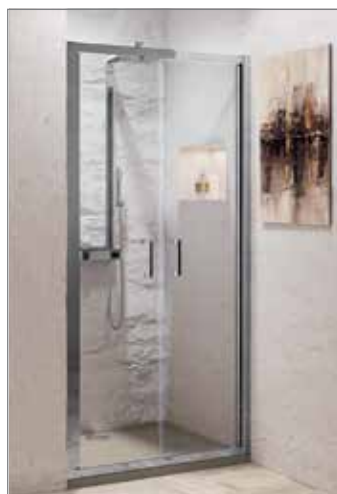
Versione con profili neri