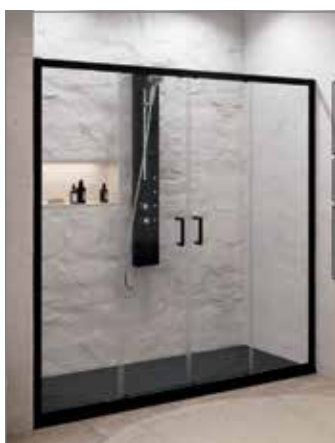
Versione con profili neri