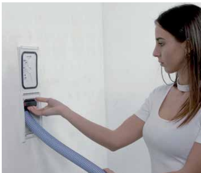
completamento senza impugnatura

Escursione fino a 15 mm per regolare l'assetto della presa.