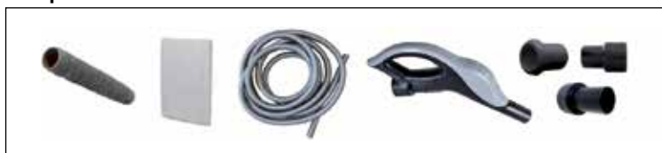
completamento versione Basic