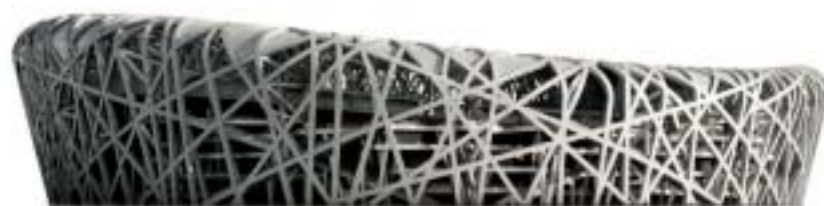
STADIO OLIMPICO BIRD'S NEST, PECHINO, CINA.